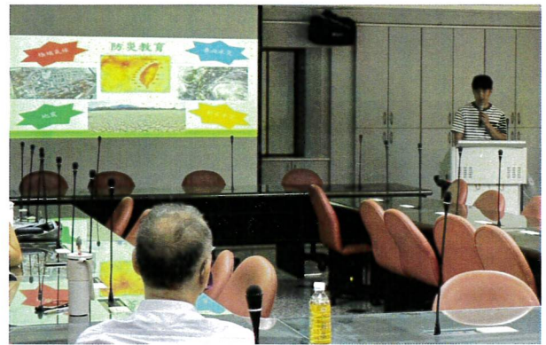
介紹各種災害的狀況