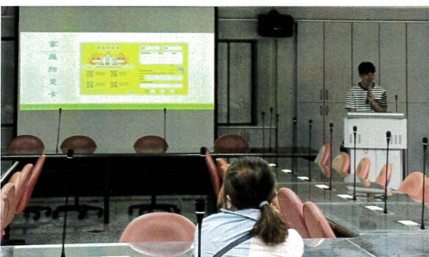
介紹認識家庭防災卡，並指導學生如何填寫