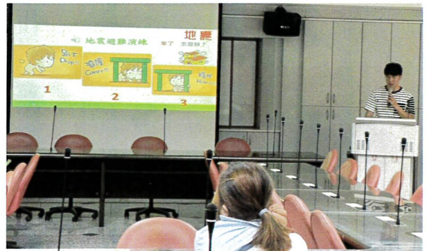
地震來了怎麼辦，趴下、掩護、穩住的口訣