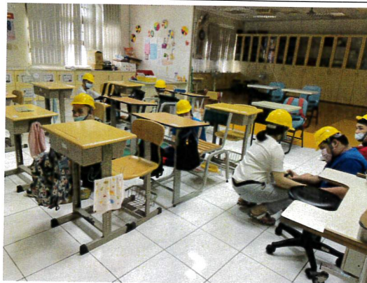
地震當下教室學生做好趴下、掩護、穩住等動作，待地震停歇後，戴好安全帽。