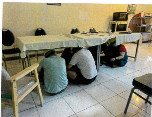
地震當下教室學生做好趴下、掩護、穩住等動作