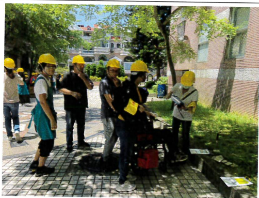
本次演練重點項目傷患處理