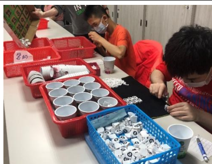
作業活動(燈頭組裝)