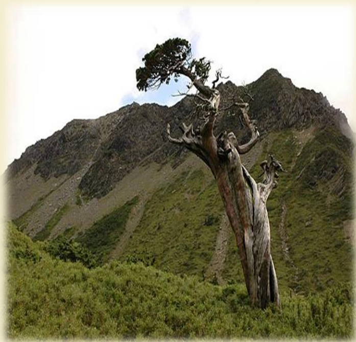
樹木長在高高的山上