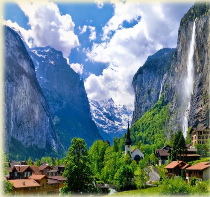
樹木長在低低的山谷