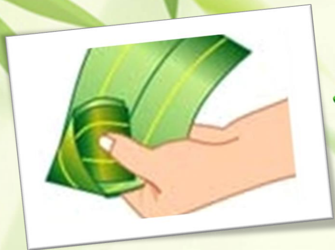
將兩張粽葉折疊成漏斗