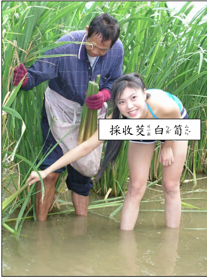
採收茭 カ 白 カ 筍 ス