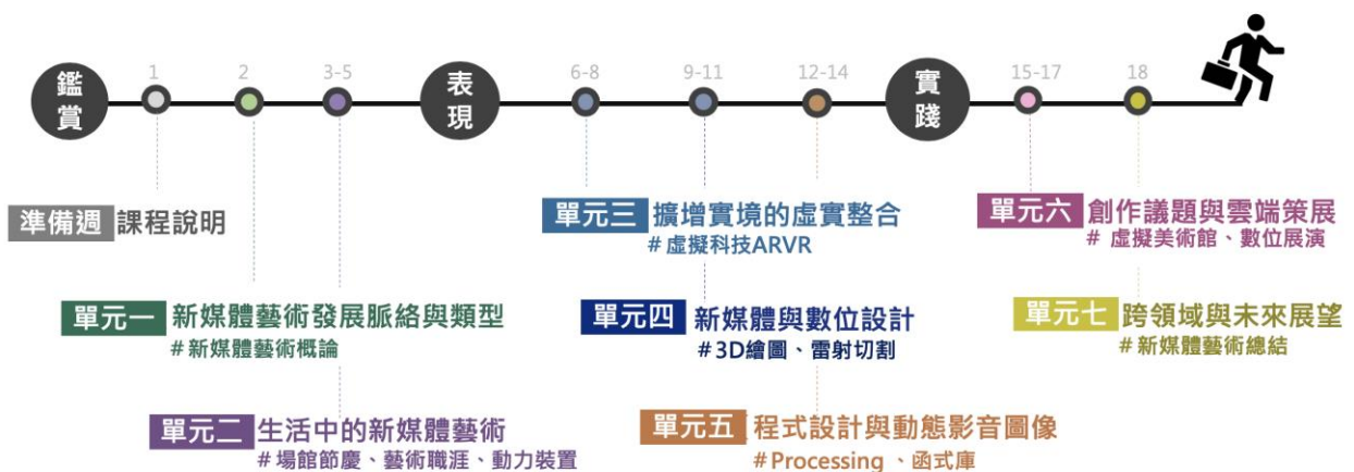
新媒體藝術線上課程單元進程圖