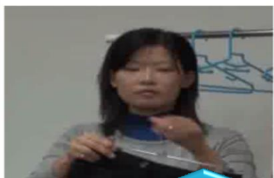
5. 無痕褲裙夾 褲子跟裙子