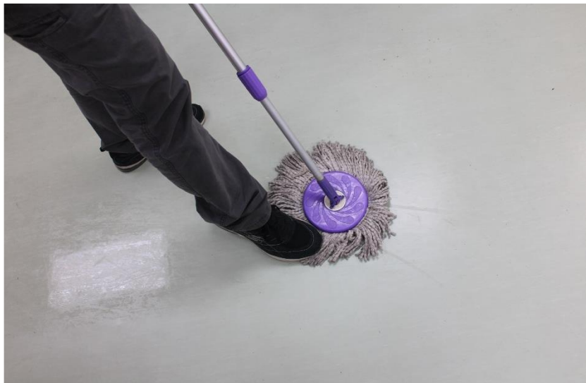
看到髒汙，用腳踩布盤